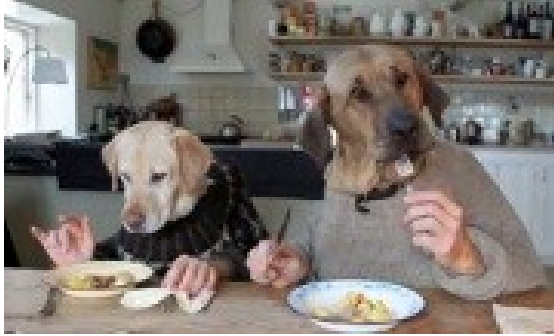
Toby en Sia aan tafel

LET OP : Honden die commerciële voeding krijgen zoals brokken, diners of blikvoer mogen beslist geen tafelresten eten, voor deze honden is dit niet goed. Voor vlees en bot etende honden kan dit geen kwaad, dit komt overeen met de darminhoud van zijn prooi die ze in de natuur vangen.